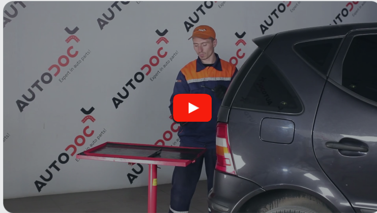
Dieses Video zeigt den Wechsel eines ähnlichen Autoteils an einem anderen Fahrzeug